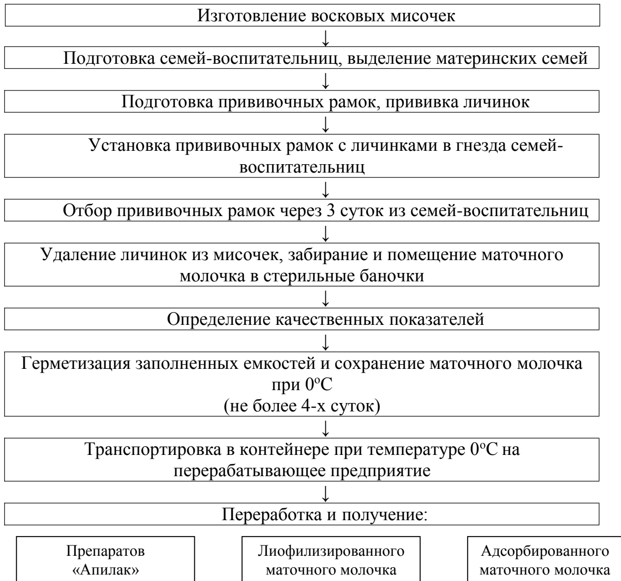
Рисунок 1. Схема технологии получения маточного молочка

Обязательно наличие специально отведенной комнаты, используемой для работ, связанных только с получением маточного молочка. В данной комнате (лаборатории) прививают личинок.