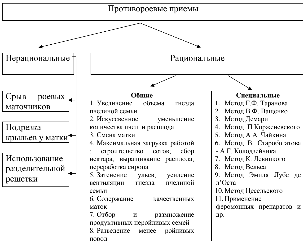
Рисунок 2 Классификация противороевых приемов

В литературе описано около 100 приемов (способов, методов) предупреждения роения пчелиных семей. Однако их можно условно разделить на нерациональные и рациональные (рисунок 2).