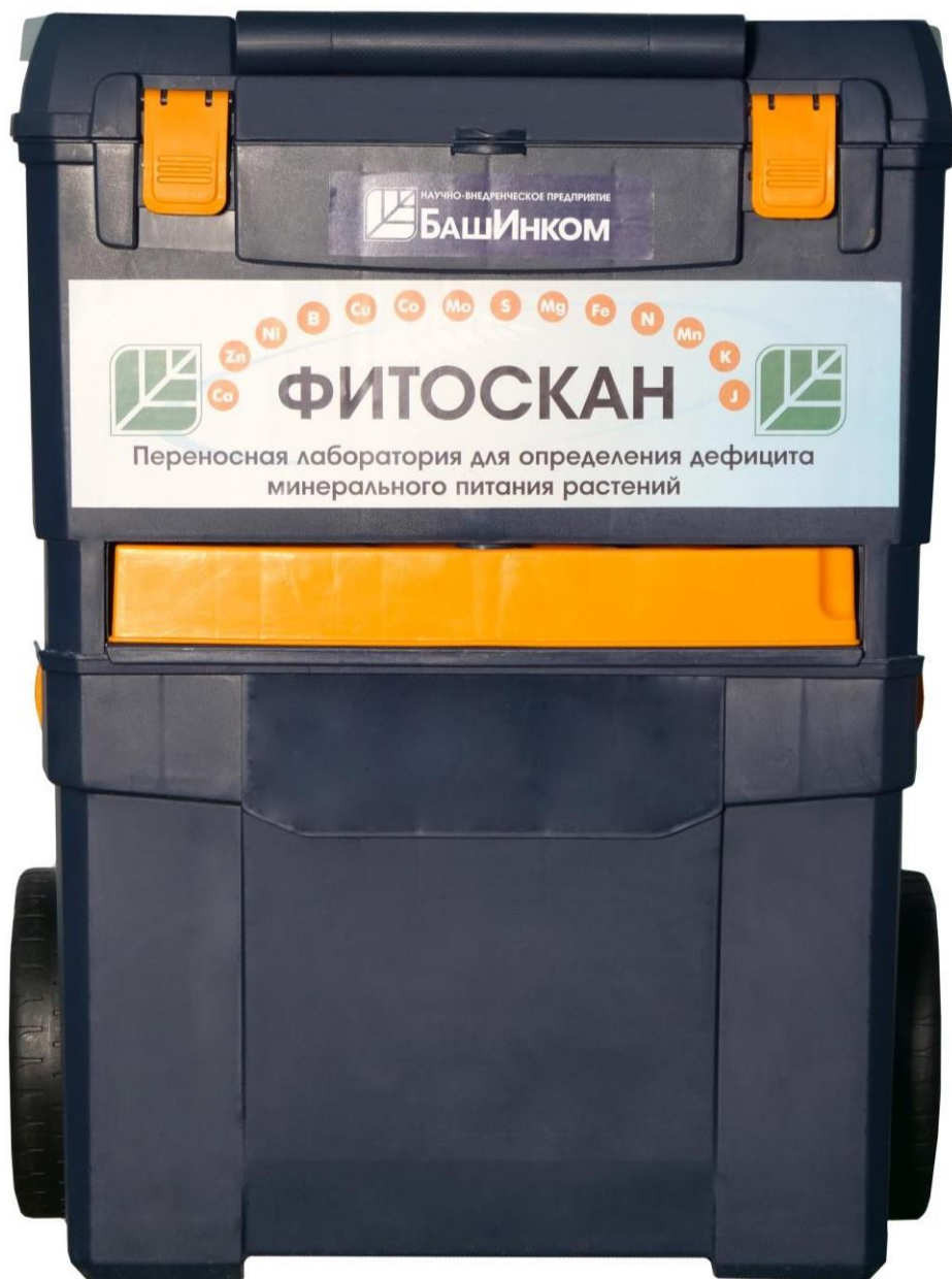
Рисунок 1. Внешний вид переносной лаборатории для определения дефицита минерального питания «ФИТОСКАН» в кейсе

Внешний вид переносной лаборатории для определения дефицита минерального питания «ФИТОСКАН» в кейсе приведен на рисунке 1, на рисунке 2 – содержание кейса, на рисунке 3 – пронумерованный состав лаборатории.