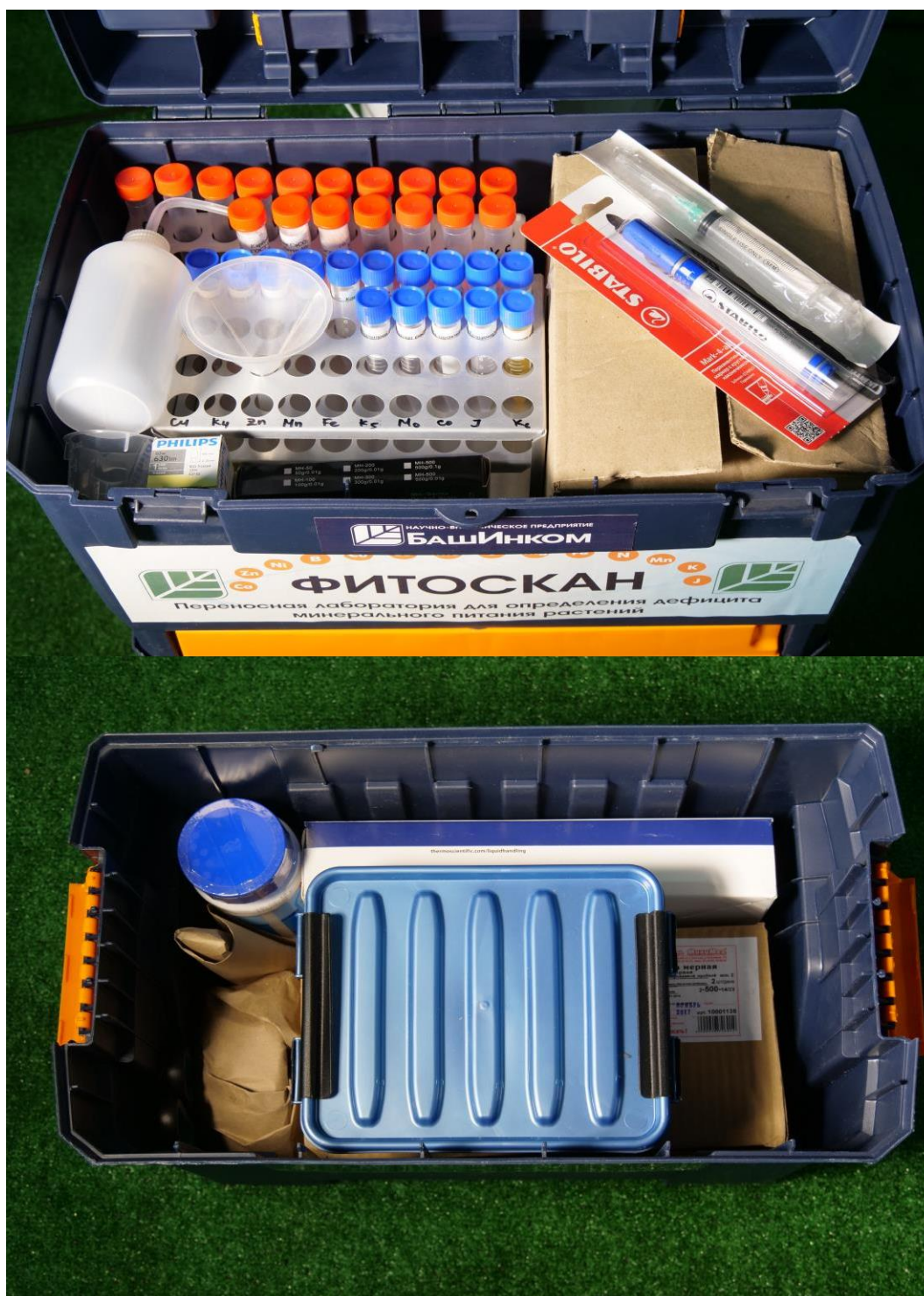
Рисунок 2. Содержание кейса с переносной лабораторией для определения дефицита минерального питания «ФИТОСКАН»