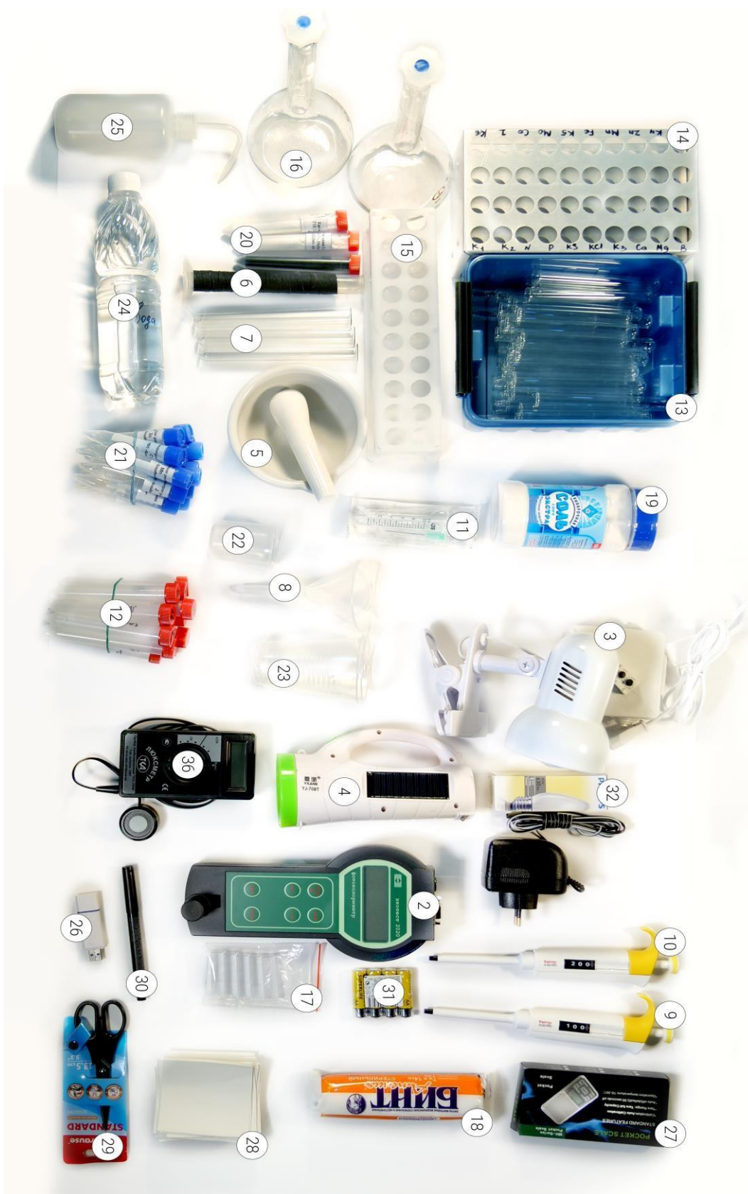
Рисунок 3. Пронумерованный состав переносной лаборатории для определения дефицита минерального питания «ФИТОСКАН»